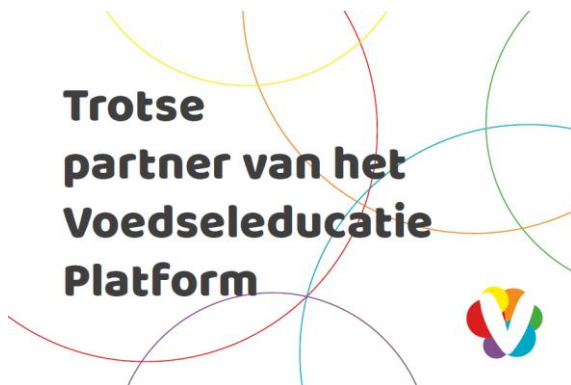
Banner partner/leden website: Trots partner van het Voedseleducatie Platform